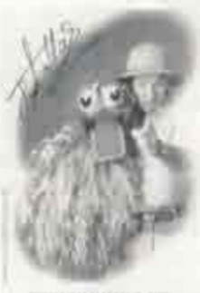
FRED VAN HALEN © ART